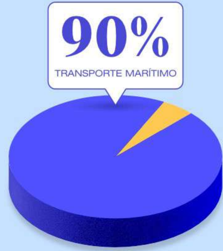
TRANSPORTE GLOBAL DE MERCANCIAS

Desde el inicio de la pandemia se han incrementado los precios de transporte, el tiempo de demora en respuesta para soluciones por parte de las navieras ha aumentado, escasez de contenedores, espacios muy limitados en los buques, aplicación de cut & run y blank sailing como acción para regular cada ruta marítima. Simultáneamente se ha acelerado la digitalización del sector.